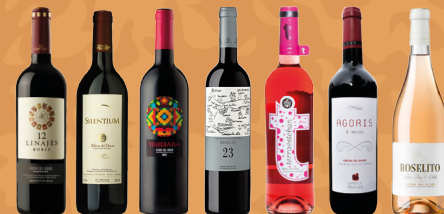
D.O.5. Hispanobodegas Doce Linajes Roble 2016