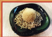
Bar El Soportal Bomba sorpresa