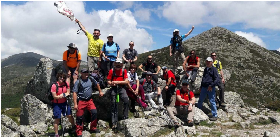
16 junio 2018 – Grupo San-Bur en el P.N. Sierra del Guadarrama, con el pico Montón de Trigo a la espalda.

¡Equípate para una actividad de montaña! ¡Ven y disfruta!