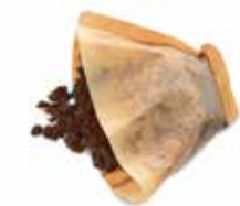
Café e infusiones