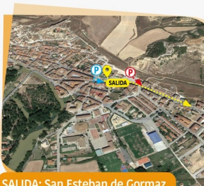
SALIDA: San Esteban de Gormaz

KM KM HORARIO HORARIO Faltan 40KM/H 42KM/H