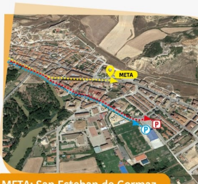
META: San Esteban de Gormaz